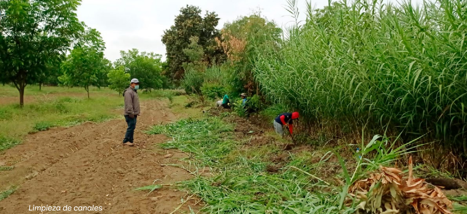
Limpeza de canales

infiltración en la Comunidad Campesina de Santo Domingo de Capillas. Durante el 2018 y 2019 el trabajo de apertura de zanjas de infiltración nos ha permitido identificar mejoras significativas en la disponibilidad del recurso para la comunidad, situación que permite una mejor planificación y gestión del riego en esta zona de Huancavelica. Los riachuelos de los sectores Jerullo y Chaccra han llevado agua de mejor calidad, por su menor contenido de sedimentos, y durante más tiempo en el año.