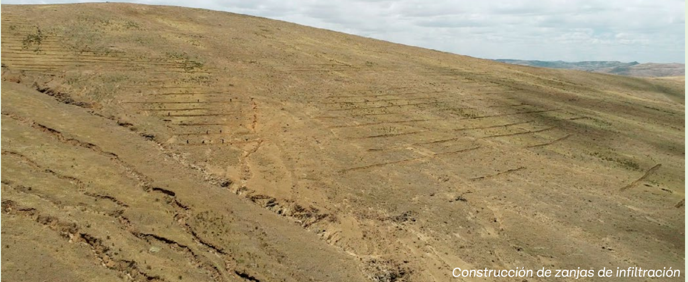
Construcción de zanjas de infiltración

El 2020 fue un año sumamente atípico para el país y nuestra institución no fue la excepción, si bien la actividad agrícola no se detuvo, algunos de nuestros procesos administrativos tuvieron que virtualizarse y el trabajo de campo restringirse. Con el transcurso de los meses de la emergencia sanitaria JUASVI protocolizó sus procesos con el fin de retomar la labor de gestión y monitoreo de nuestro acuífero. En la medida que las autoridades mantengan la alerta sanitaria por COVID 19, nuestra institución cumplirá estrictamente lo establecido por el MINSA y las autoridades competentes. En este sentido, la aplicación de la tecnología es fundamental para nuestro trabajo diario y eso se ha visto reflejado en el uso de equipos remotos,